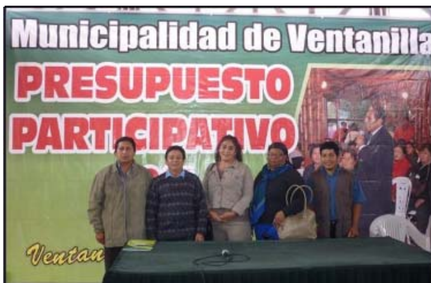
Miembros del Comité de Vigilancia Presupuesto Participativo 2011